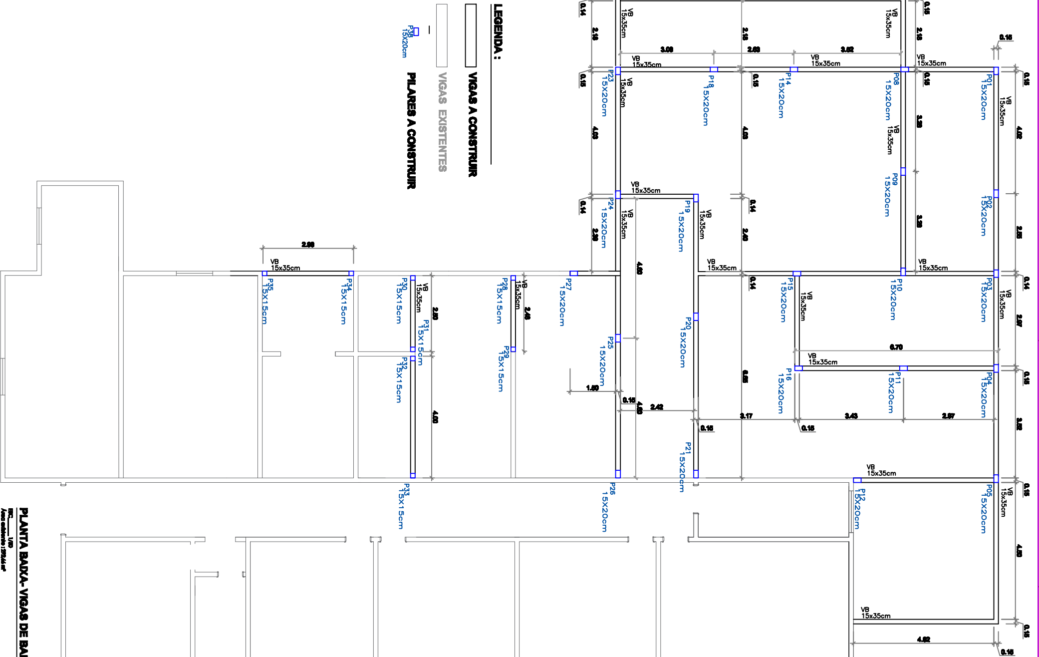
PLANTA BAIXA-VIGAS DE BALDRAME